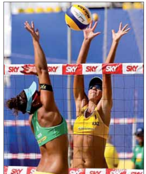
Képünk illusztráció