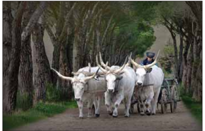
Úton – Az év képe (Large Color Print)