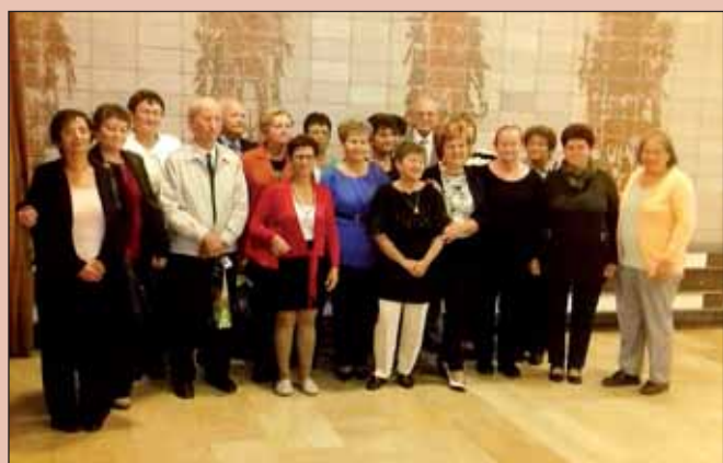
40 éves osztálytalálkozóját tartotta 2017. szeptember 23-án a nagykovácsi Toldi Miklós Élelmiszeripari Szakképző Iskola és Kollégium 1974–77-ben végzett 3 a–k. évfolyama.