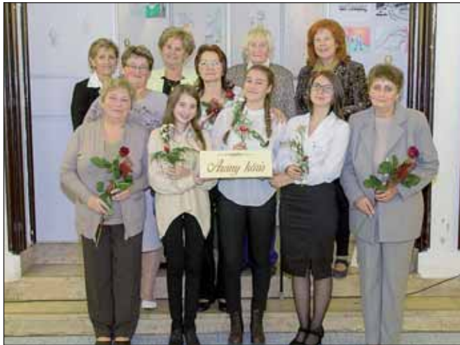
A győztes csapat a mentorokkal

Az Arany-évforduló tiszteletére Kecskeméten meghirdetett műveltségi vetélkedő – országos és határon túli résztvevőkkel – a III., döntő fordulójához érkezett. A nagyszülő- és unokakorú versenyzőkből összeállított csapat (3 fő 60 év feletti, 3 fő 15 év alatti) áprilistól az I-II. forduló feladatait levélben küldhette el. Már a két levelezős forduló is páratlan sikert hozott: a maximális 190 pontból 189-et szerzett csapatunk.