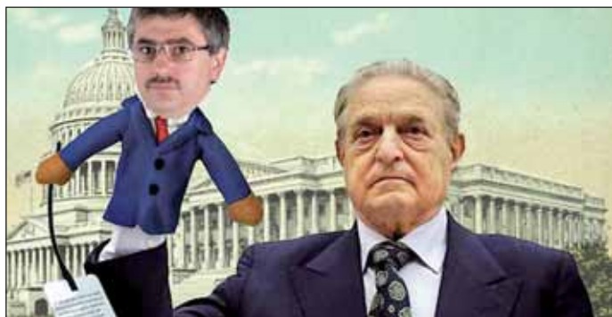
Képünk illusztráció: Kustár és Soros

„Döbbenetes! Az Európai Parlamentben tényleg megszavazták a kötelező kvótát. Dömötör Csaba, a kormány kommunikációért felelős államtitkára hozta nyilvánosságra délután: az Európai Parlament tényleg megszavazta a kvótát, azaz a kényszerbetelepítést és a felső korlát nélküli befogadást. A baloldal két képviselője, köztük a magyar Molnár Csaba (DK) és az MSZP-s Szanyi Tibor EP-képviselők is igennel szavaztak a javaslatra. Az uniós intézmények megindítanák a betelepítéseket. Nem önkéntes, hanem kötelező jelleggel. Allandó rendszert hoznának létre, létszámkorlát nélkül. Ez még nem minden: a betelepítéseket ott kezdenék, ahol szerintük még nem fogadtak be elég bevándorlót. Tehát például Magyarországon” – írta a Híradó.hu november 16-án.