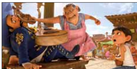
Jelenet a Coco című amerikai családi animációs filmből

Az aktuális moziműsort keresse a www.nagykoros.hu honlapon, a Körös Art Mozi és az Önkormányzati Hírek Nagykovács facebook oldalain!