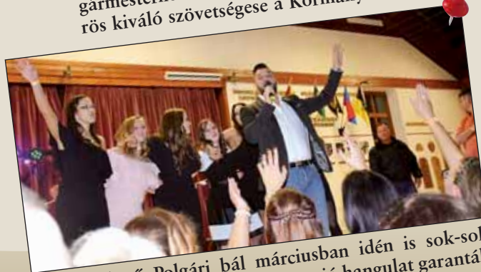
A nagyszerű Polgári bál márciusban idén is sok-sok meglepetéssel várta a vendégeket, a jó hangulat garantált volt