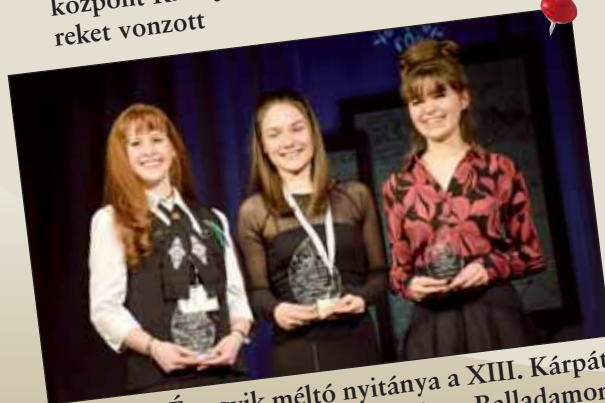
Az Arany-Év egyik méltó nyitánya a XIII. Kárpát-Medencei Középiskolai Arany János Balladamon-dó Verseny volt