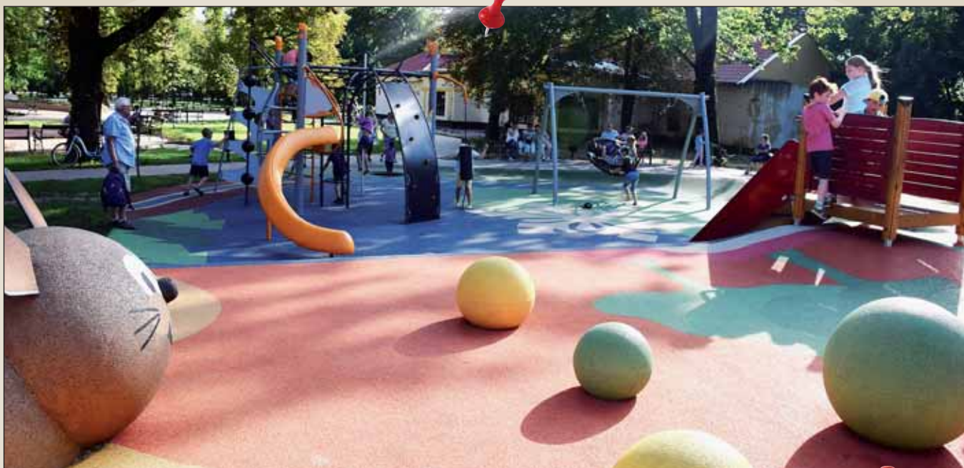
Megújult a Cifrakert bruttó 225.966.124 Ft összköltségből – Nagykőrös „Zöld szíve” újraéledt