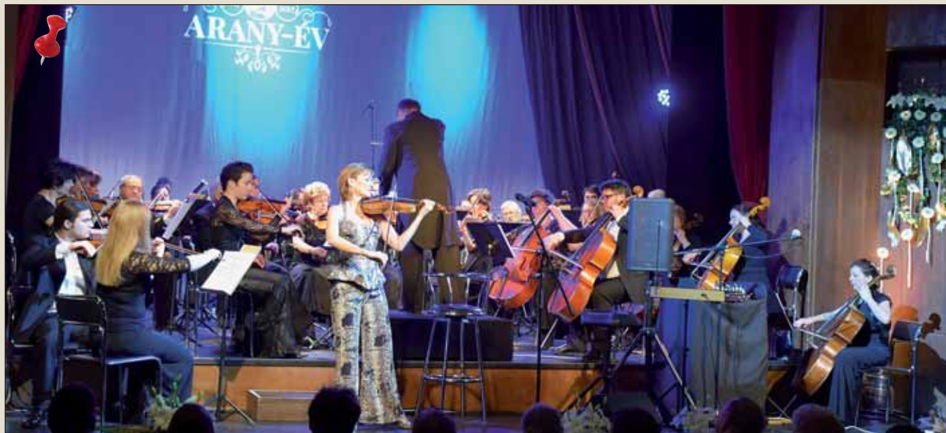
A hagyományokhoz hűen fergeteges Újévi Koncerttel köszöntötték az újesztendőt Nagykőrösön

Képes visszatekintővel elevenítjük fel a 2017-es esztendő legszebb pillanatait. Éljük át újra, együtt az elmúlt év eseményeit. Mostani lapszámunkban januártól júniusig, vagyis az elmúlt év első félévének történéseiből válogattunk. Folytatás a jövő heti lapszámban!