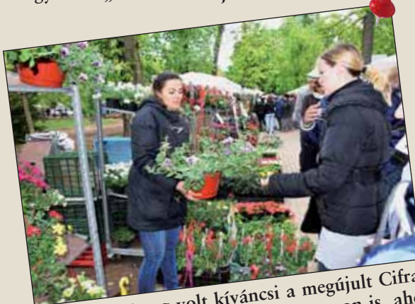
Hatalmas tömeg volt kíváncsi a megújult Cifrakertre a Szent György Napi Forratagon is, ahol a sok-sok program mellett óriási virágvásár is várta a vásárlókat