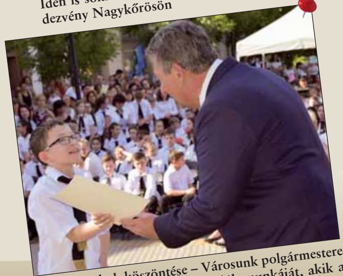
Kiváló Diákok köszöntése – Városunk polgármestere idén is megköszönte azon tanulók munkáját, akik a tanév során különböző versenyeken sikereket értek el