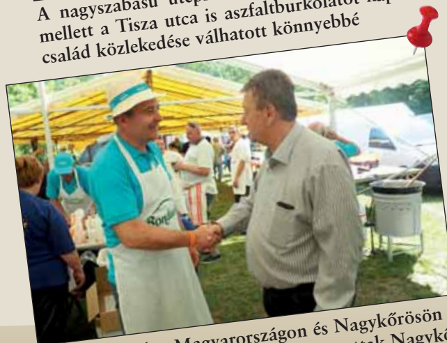
25 éve van jelen Magyarországon és Nagykőrösön a Bonduelle, így Jubileumi Majálist tartottak Nagykőrösön, a Pálfájában