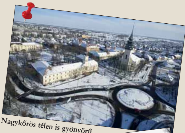
Nagykőrös télen is gyönyörű