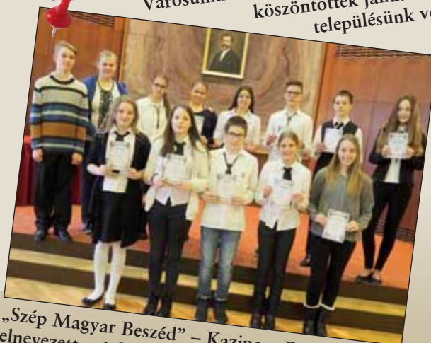
„Szép Magyar Beszéd” – Kazinczy Ferencről elnevezett szépkiejtési verseny díjazottjai