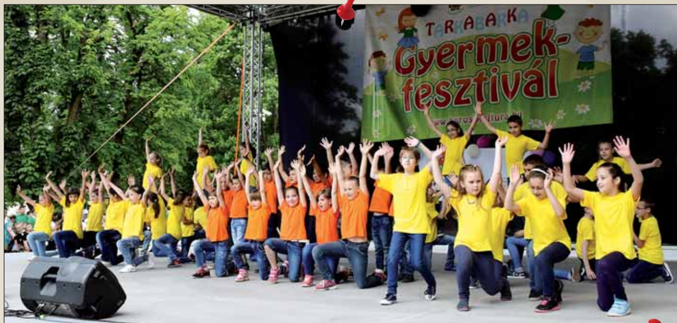
Nagy siker volt a TARKABARKA Gyermekfesztivál a megújult Cifrakertben, számos új programmal és játékkal