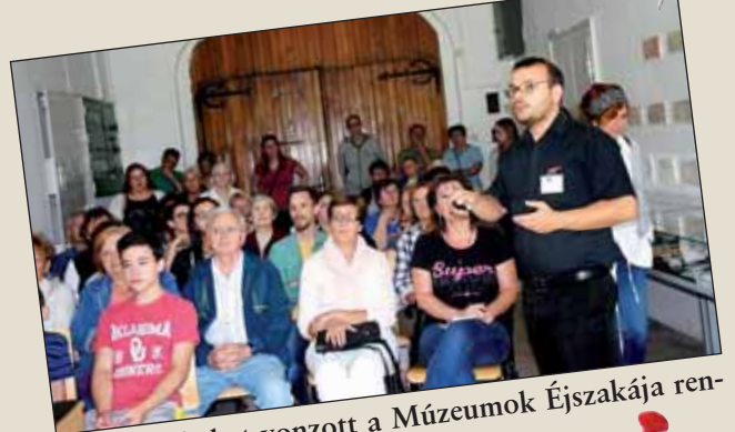
Idén is sokakat vonzott a Múzeumok Éjszakája rendezvény Nagykőrösön