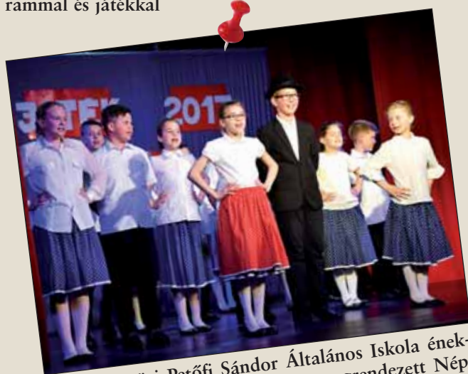
A Nagykőrösi Petőfi Sándor Általános Iskola énekzene tagozatos osztályai részére megrendezett Népi Játék Gála a kulturális központ színháztermében ezúttal is nagyon látványos volt