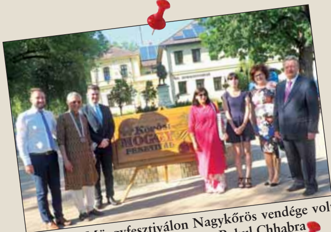
A Körösi Mogygyesztiválon Nagykőrös vendége volt India magyarországi nagykövete, Rahul Chhabra