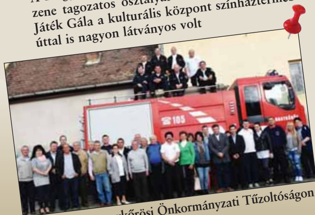
Flórián-nap a nagykőrösi Önkormányzati Tűzoltóságon