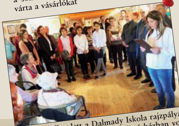
Országos siker lett a Dalmady Iskola rajzpályázata, a nagysikerű kiállítás a Tímárházban volt látható