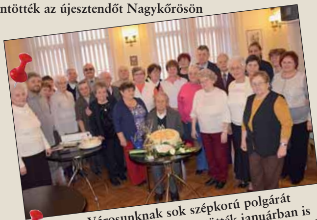
Városunknak sok szépkorú polgárát köszöntötték januárban is településünk vezetői