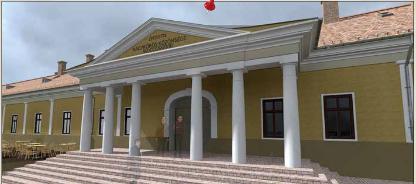
Koncepcióterv – Megújul a Múzeum – „Arany János-emlékévé, Nagykőrös, Arany János városa” programsorozat keretében felújításra, átalakításra kerül az Arany János Múzeum épülete is