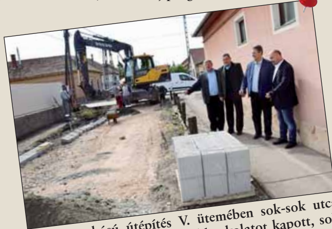
A nagyszabású útépités V. ütemében sok-sok utca mellett a Tisza utca is aszfaltburkolatot kapott, sok család közlekedése válhatott könnyebbé