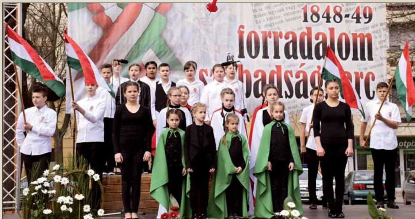
Méltó városi megemlékezés, az 1848/49-es forradalom és szabadságharc tiszteletére rendezett városi megemlékezésen a Nagykőrösi Kossuth Lajos Általános Iskola adott ünnepi műsort