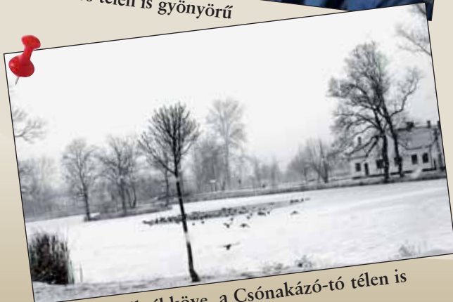
A város egyik ékköve, a Csónakázó-tó télen is varázslatos