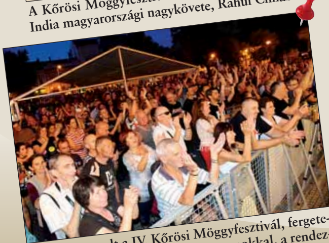
Óriási siker volt a IV. Körösi Mogygyesztivál, fergeteges koncertekkel, változatos programokkal, a rendezvény több ezres tömeget vonzott