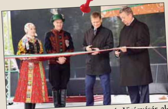
A Szent György Napi Forratag és Virágvásár alkalmával került átadásra az EGT Alapok támogatásával megvalósuló projekt, a megújult Cifrakertben Őexcellenciája Olav Berstad, Norvégia magyarországi nagykövete is szólt a nagykőrösiekhez