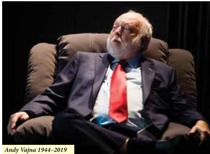
Andy Vajna 1944–2019

Andy Vajna a világ egyik legnagyobb tekintélyű producere volt. Producerként 59 film fűződik a nevéhez, köztük olyan világszerte ismert és elismert alkotások, mint a Szabadság szerelem, a Zenedoboz (Music Box), a Rambo-filmek, az Angyalszív, a