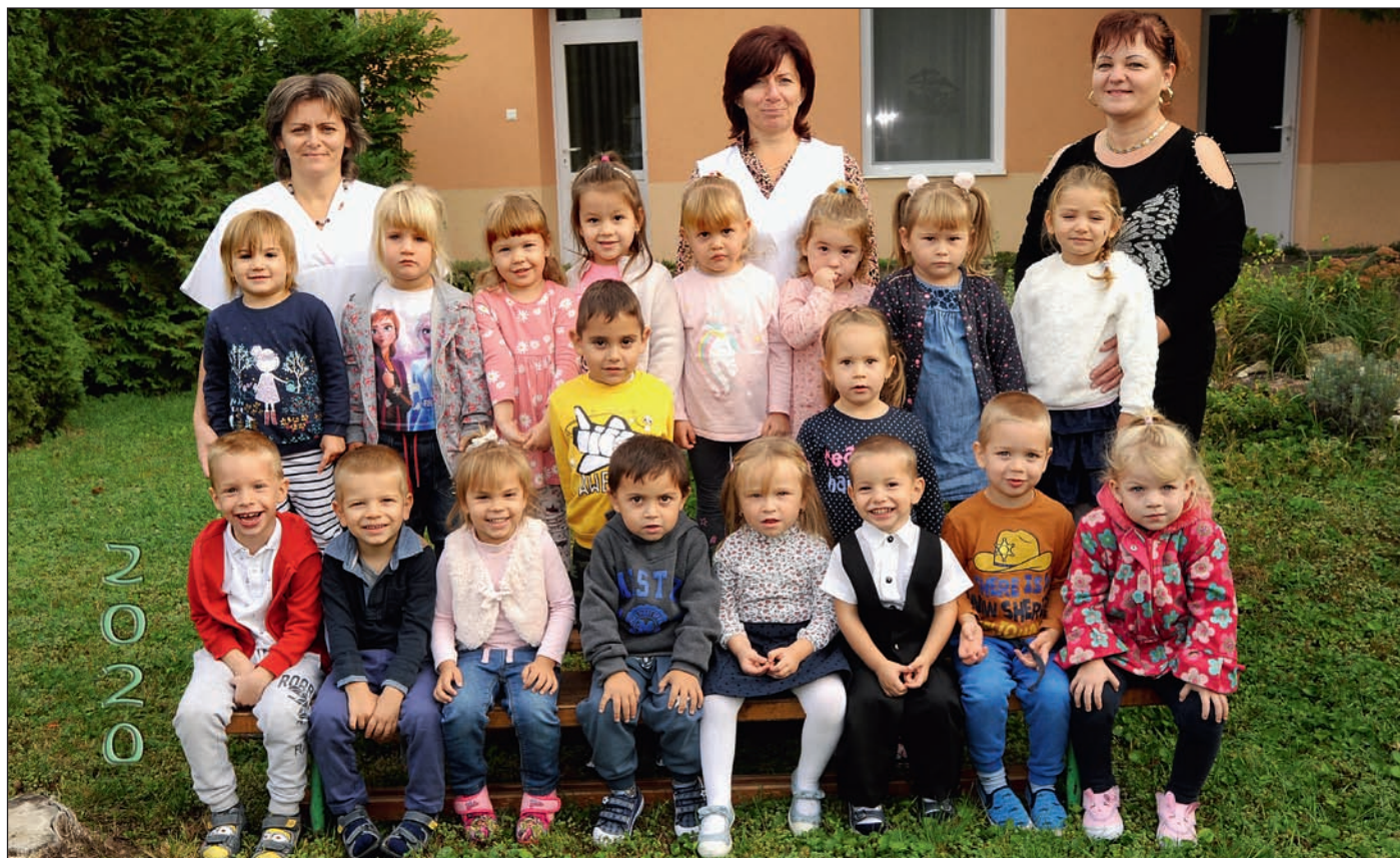
Bemutakozik a Nagykőrösi Városi Óvoda Batthyány utcai Telephelyének új csoportja