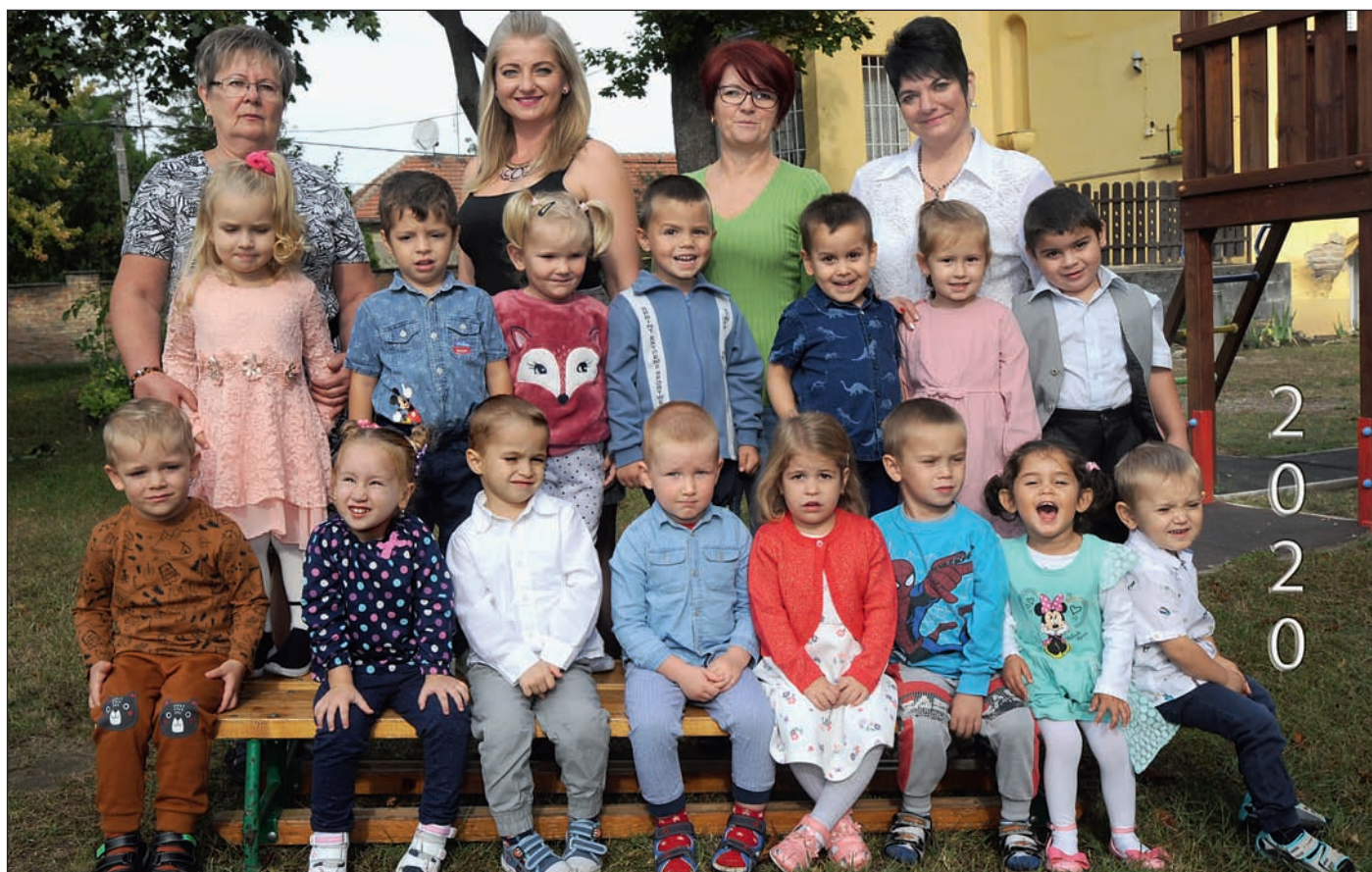
Bemutakozik a Nagykőrösi Városi Óvoda Kalocsa Balázs Tagóvoda Eötvös Károly úti Telephelyének új csoportja