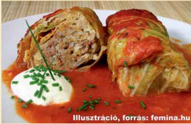
Illusztráció, forrás: femina.hu

Darált hús 1,5 kg /lehet zsírosabb/ Rizs kb. 15 dkg Só, őrölt bors, köménymag, fokhagyma, pirospaprika Savanyú apró káposzta 0,5 kg Savanyú hasáb káposzta kb. 15 db