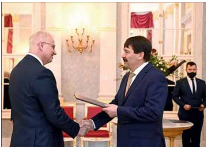
Áder János köztársasági elnök rektori megbízást adott át Prof. Dr. Trócsányi László egyetemi tanárnak január 31-én a Sándor-palotában.

Trócsányi László rektori kinevezését a Magyarországi Református Egyház kezdeményezte, az egyetem Szenátusa pedig 2022. január 5-i ülésén támogatta rektori tisztségre történő felterjesztését és rektori tisztségre történő kinevezését 2022. február hó 1. napjától 2027. január hó 31. napjáig terjedő időtartamra.