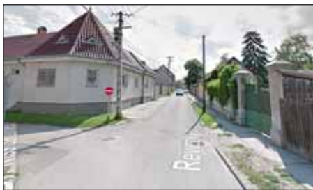
A Reviczky utcában is 30-as sebességkorlátozás lesz

Február 2-án tárgyalta Nagykőrös Város Önkormányzat Pénzügyi és Városüzemeltetési Bizottsága a „Forgalmi rend változtatására irányuló javaslatok” című előterjesztést.