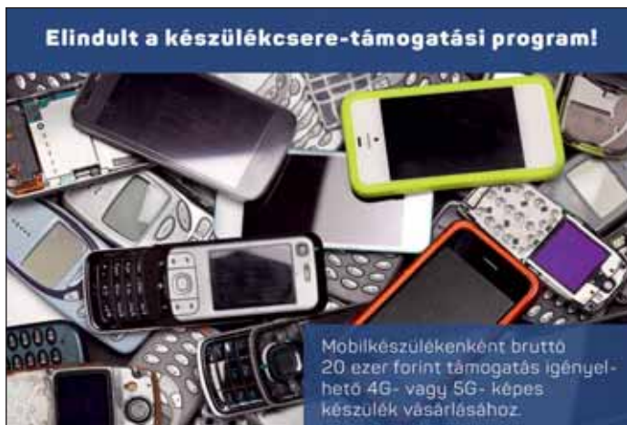
Elindult a készülékcseretámogatási program!

Mobilkészülékenként bruttó 20 ezer forint támogatás igényelhető 4G- vagy 5G- képes készülék vásárlásához.