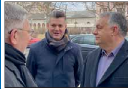
Dr. Körtvélyesi Attila alpolgármester Orbán Viktor miniszterrel és Földi László országgyűlési képviselő társaságában

2021-ben is helyt álltak a nagykőrösi tűzoltók, több esetben, és bebizonyították újfent, szükség van rájuk a város biztonsága érdekében. Stabil lábakon áll a szervezet, kiszámítható bevételekkel. Mind az Országos Katasztrófavédelmi Főigazgatóság, mind az Állami Számvevőszék vizsgálatai során mindent a jogszabályi előírásoknak és gazdasági követelményeknek megfelelően talált. Megújult a Tűzoltóság kapuja, és szeretnénk majd az épület megújítást folytatni. Eszközparkunk, mind a kézi szerszámok, mind a gépjárműveket illetően sokat fejlődött az elmúlt években, így most az épületre szeretnénk inkább fókuszálni. A tavalyi év végén jutalommal, ajándékkal és SZÉP kártya juttatással köszöntük