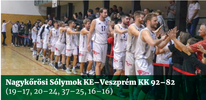
Nagykőrösi Sólymok KE – Veszprém KK 92–82 (19–17, 20–24, 37–25, 16–16)