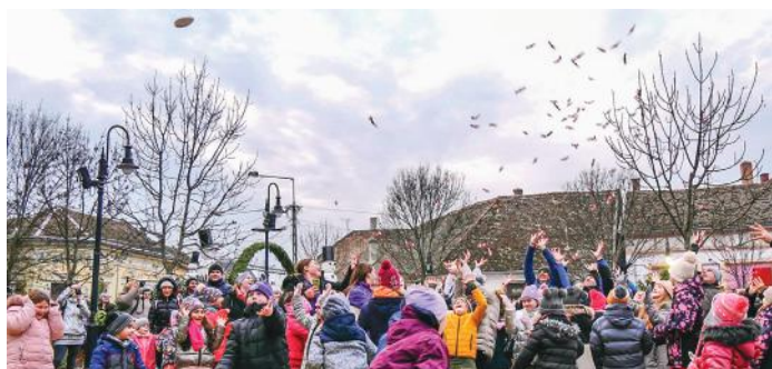
Szaloncukoresővel kedveskedtek a kicsiknek és nagyoknak