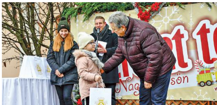
Az én karácsonyom rajzpályázat eredményhirdetése és díjátadója

művesek-árusok szeretettel várják a különleges ajándékokat keresőket, valamint azokat, akik forró ételre-italra vagy éppen édességre vágnak – mindenkit vár a SZERETET TERE. ÁLDOTT ADVENTET, NAGYKÖRÖS!