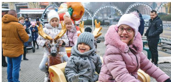
Rengeteg érdeklődőt vonzanak a programok