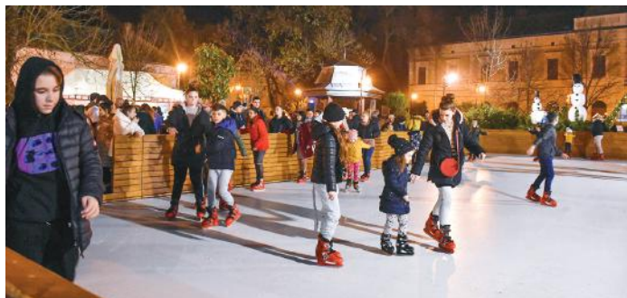
Idén műjégpálya is van Nagykőrösön