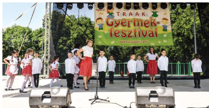
Názáret óvoda Halacska csoport fellépése.