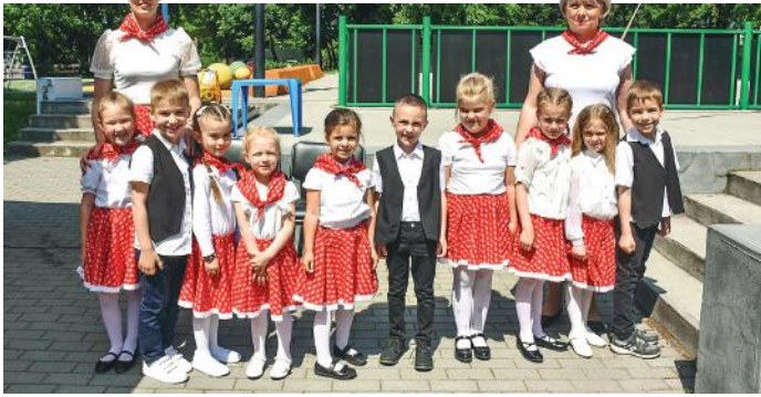
Népi gyermekjátékot adott elő a Kárász utcai ovi Süni csoportja.