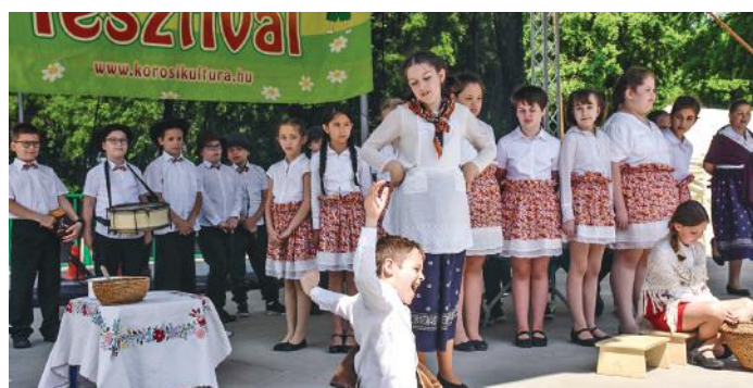
A Rákóczi-iskolások népi játéka.