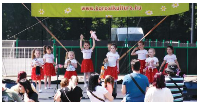
A Relevé legkisebb táncosainak fellépése.