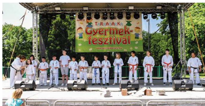
A Power Karate SE nagykőrösi csoportjának karatebemutatója.