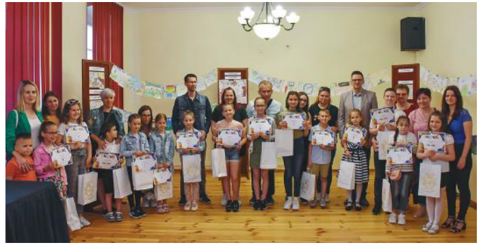
Szeretem Nagykőrös rajzpályázat díjátadója.