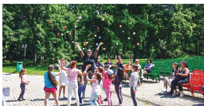
Mosolyra Hangolók gyermekműsora.