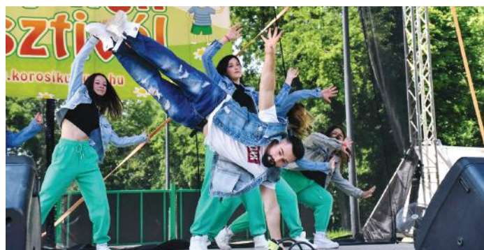
A kulturális központ hiphoptáncscsoportjai is felléptek.