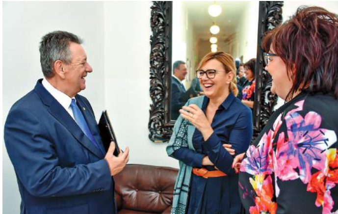
Borbás Marcsi a Virágos Magyarország verseny után is visszatért Nagykőrösre. A városunkban forgatták a Gasztroangyal című műsor egyik epizódját.

Magyarországgal, akkor elájultam. Az egy csoda, ami ott van! Gyönyörű szép! Van öt hektár park a központban, elképesztően kezelve, gyönyörű virágos a főtere. A közvetlen környezetében olyan bálványfák, hogy az valami csoda!” – mondta el Borbás Marcsi a Virágos Magyarország versenyről készített interjúban, a Kossuth Rádió Jó reggelt, Magyarország! című műsorában.