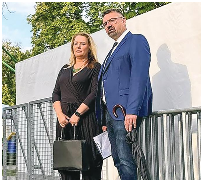
Illusztráció, képünk a 2023-as Polgárrá Fogadáson készült.