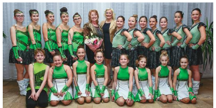
➔ Fotók: Varga Irén fényképészmaster