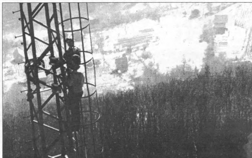
Másnap délelőttre az Antenna Hungária az ÉMÁSZ és a Polgári Védelem szakemberei elhárították a hibát.