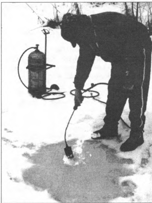
Lékhorgász gázzal.