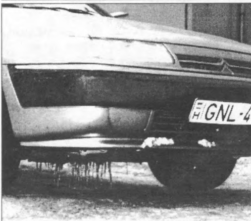
Télen még a kézifékre sincs minden esetben szükség, különösen a képen látható Citroën gépkocsinál, amelyet jégcsapok rögzítenek az elmozdulás ellen.