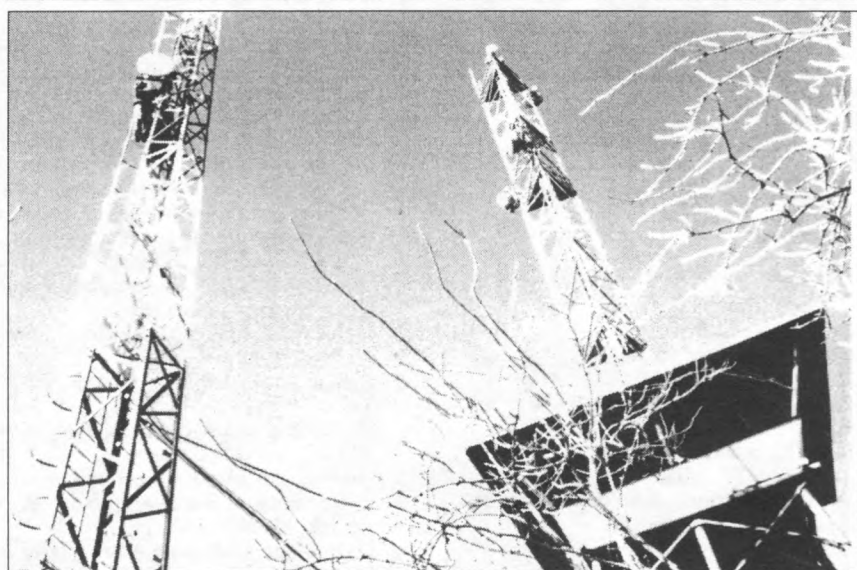
Sátoraljaújhely környékén, február 9-én szokatlan időjárás volt, dörgött és villámlott. A villámlás gondot okozott a tévéműsorok sugárzásában és a mobiltelefon szolgáltatásban.