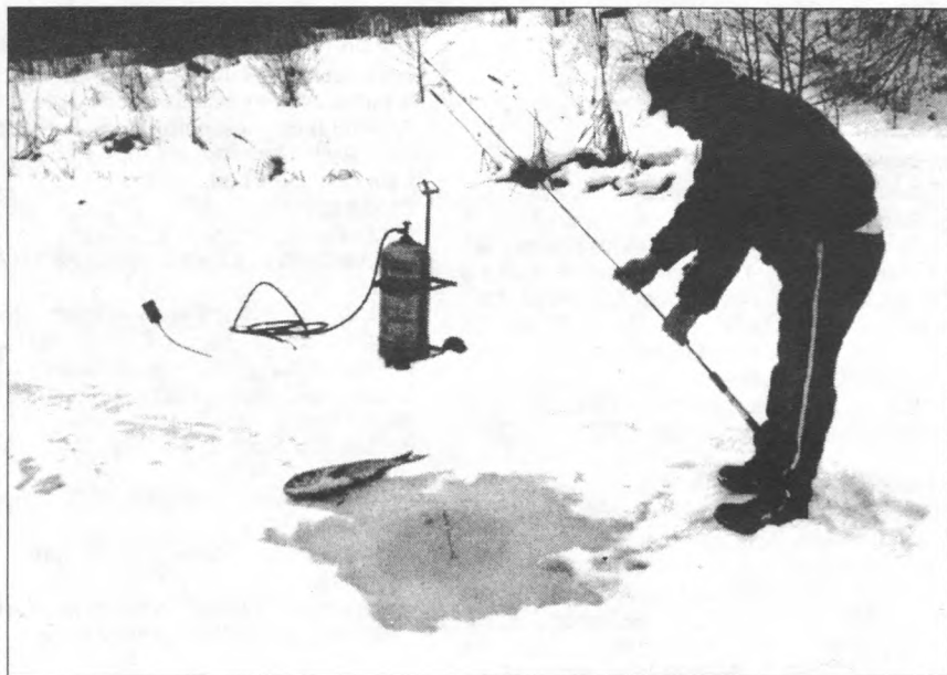
A leleményes zempléni lékhorgászok új módszerekkel készítik a léket a befagyott tavakon. A 40 cm vastag jeget gázpallackkal működtetett perzselővel olvasztják át, így jutnak a vízfelülethez és a halhoz.