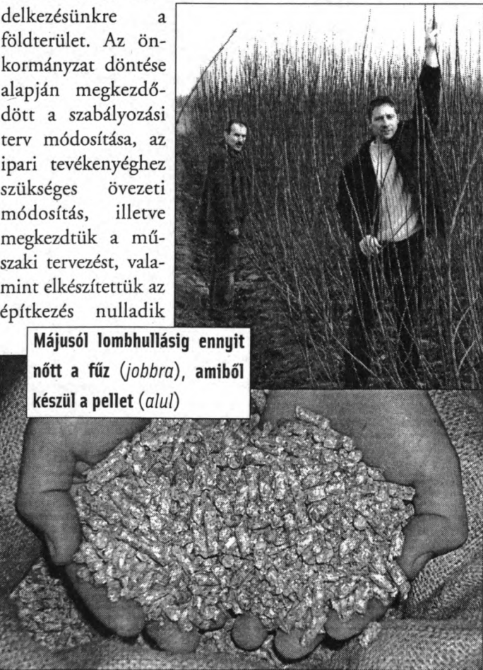
Májusól lombhullásig ennyit nőtt a fűz (jobbra), amiből készül a pellet (alul)

(A beruházással kapcsolatos felhívás a 23. oldalon)