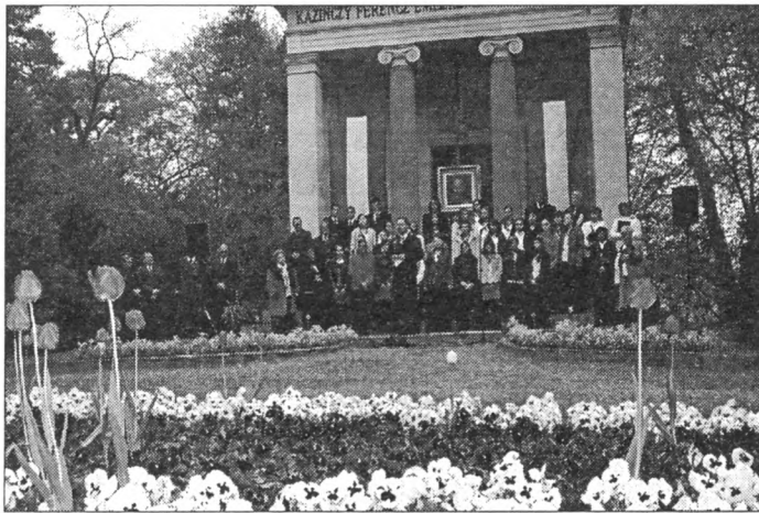
AZ ÜNNEPÉLYES MEGNYITÓ

lönböző ábrákat, amelyek leköthetnék az ember tekinteték, de egyszerűen nem is tudom, hogy mik vannak oda felírva, rajzolva, mert nem is figyelek oda, mert nem nyílik ki rá a szemem. Úgy érzem, hogy ebben a formában ez nem kezelhető dolog, átléptem rajta.