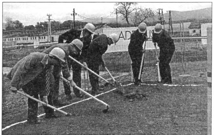
A JELKÉPES, ELSŐ KAPAVÁGÁSOK