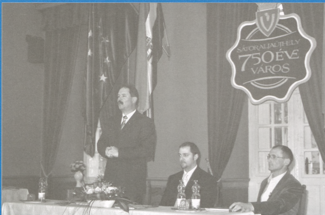
Sátoraljaújhely képeslapokon - 3. oldal

2011. 02. XX. ÉVFOLYAM 2. SÁTORALJAÚJHELY VÁROS KÖZÉLETI HAVILAPJA