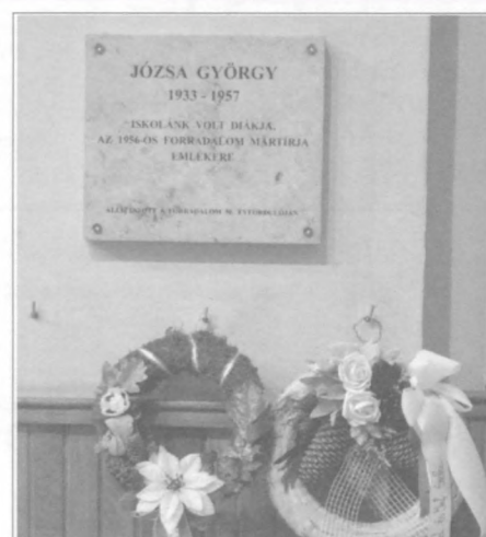
Az áldozatokra emlékeztek - 2. oldal