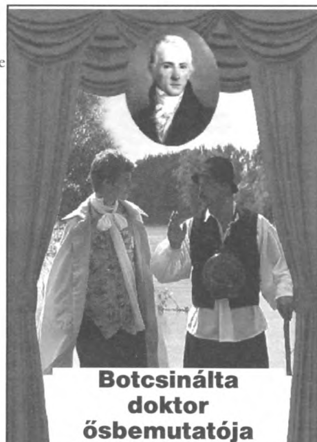
Botcsinálta doktor ösbemutatója

Elkészült Kazinczy Ferenc Botcsinálta doktor című népszínművéből az első vidéki tévéfilm, amely március 4-én A Magyar Nyelv Múzeumban debütál a meghívott vendégek előtt.