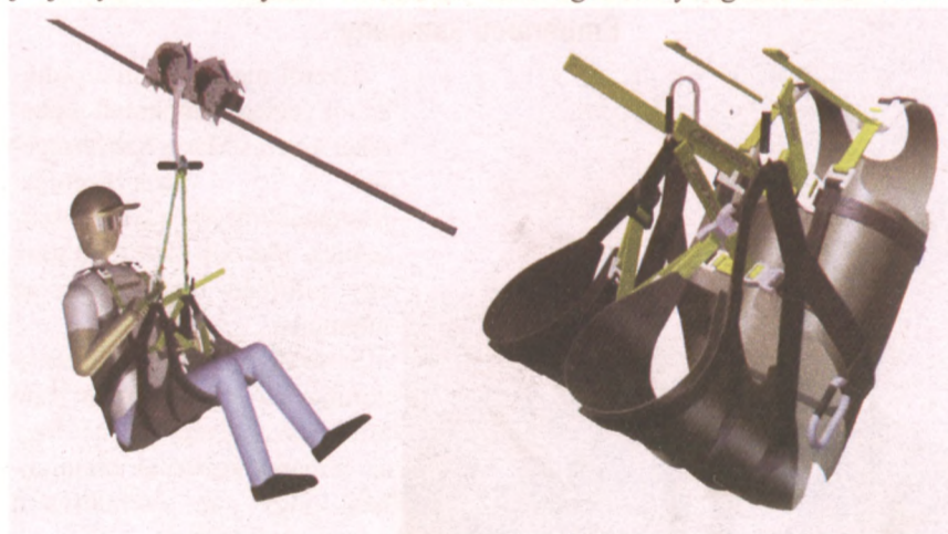
SPECIÁLIS BEÜLŐ A DRÓTKÖTÉLPÁLYÁN

A Magas-hegyi Sportcentrum bővítése mellett a térségben további két turisztikai fejlesztés is végbemegy. Sárospatakon a Végardó fürdőhöz kapcsolódva gyógy-centrumot alakítanak ki, Füzéren a vár újul meg, mintegy másfél milliárd forint értékben.