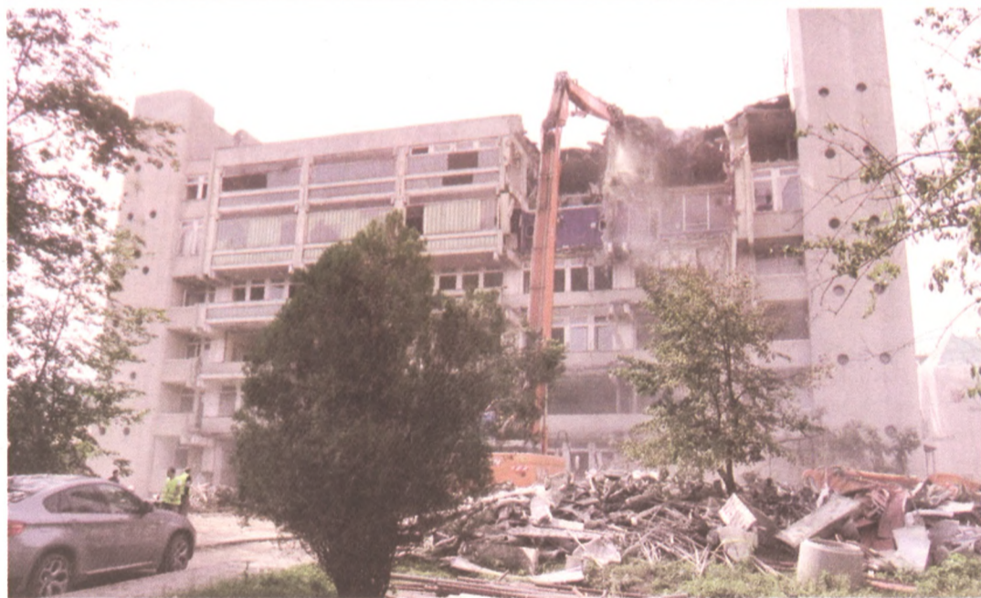
ELKEZDTÉK AZ ÉRZSÉBET KÓRHÁZ VOLT SZÜLÉSZETÉNEK BONTÁSÁT. HELYÉN PARKOLÓ ÉPÜL.