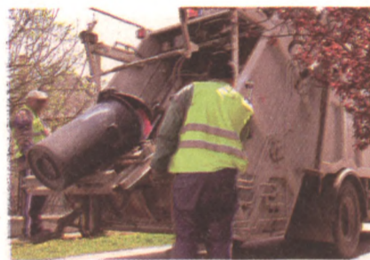
Amennyiben ezek a személyek továbbra sem rendezik a szolgáltatási

Az önhibájukból tartozást felhalmozóknak december 31-éig el kell kezdeni az adósságot törleszteni, ellenkező esetben az önkormányzat kommunális adója őket érinteni fogja.