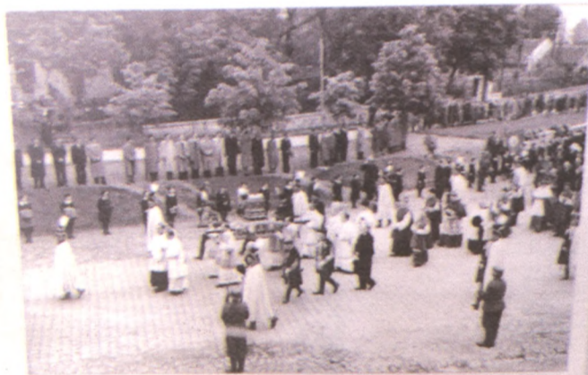
A Szent Jobb útja a Kossuth Ferenc (ma Fásor) utcán