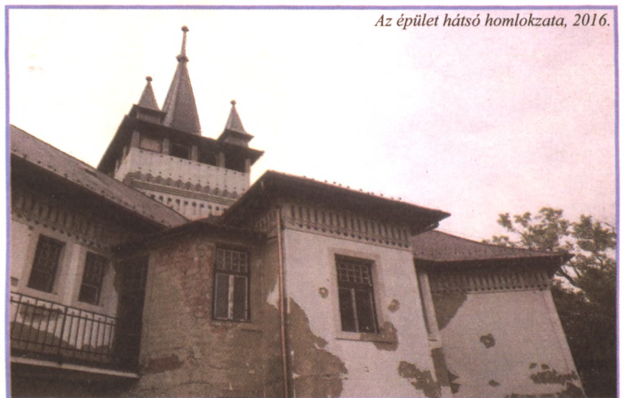
Az épület hátsó homlokzata, 2016.