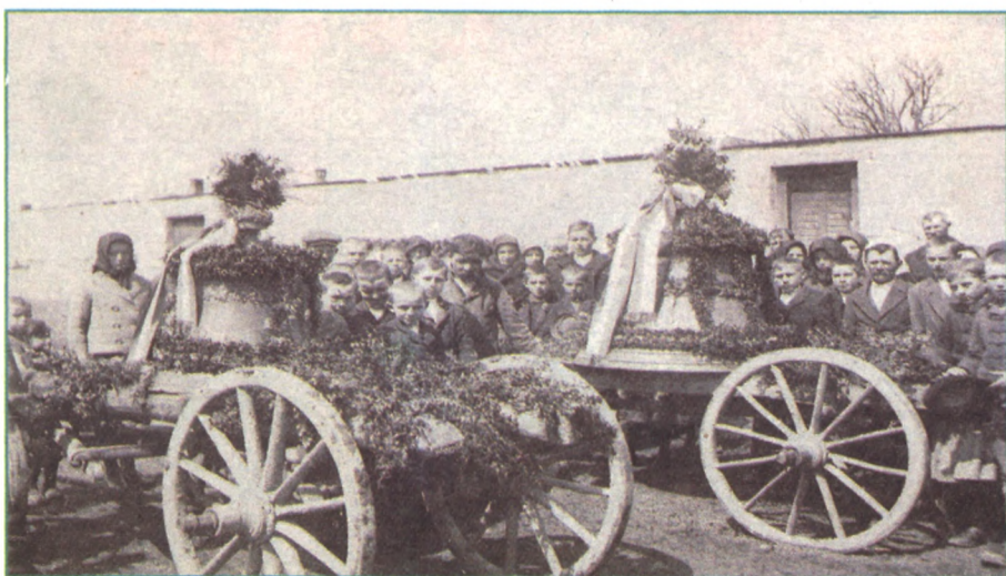
A fotó Sárospatakon készült.