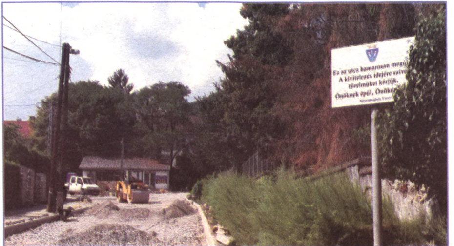
HAMAROSAN KÉSZ AZ ESZE T. ÉS MÁRTÍROK UTCA FELÚJÍTÁSA

érinti Rudabányácskát és Károlyfalvát is. Széphalmon indult el az építkezés, de még az éven folytatódik az említett két településen is. Ez egy 300 millió forintos beruházás, ami a Terület-és Településfejlesztési Operatív Program része, és egy régóta tervezett program. Széphalom több utcájában lesznek új vízvezető árkok, átvezetők. Arra törekedtünk, hogy az évek óta fennálló problémákat szüntessük meg, ez után jöhet a többi terület. Önrészt is tettünk hozzá, így minden kapubejáró megújul az érintett utcákban. Ez az első üteme a vízrendezésnek, tervezzük a folytatást mindenhol.