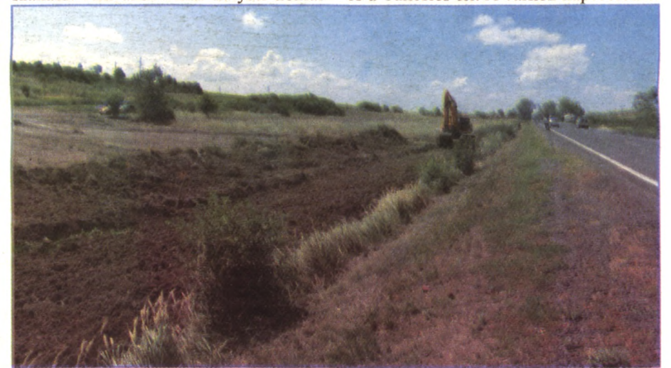
AZ ÚJ IPARI PARK TERÜLETE

SZ.P.: Befejeződött a felújítás a mezőgazdasági középiskolában és az Esze Tamás Általános Iskolában. Mindkét épületnek az energetikai korszerűsítését vállalta a város, az előbbit a görögkatolikus egyház fejleszti tovább a kollégiummal együtt. Közel egy milliárd forintot költenek még rá. A Kossuth Lajos Gimnázium energetikai korszerűsítése is lassan befejeződik, 156 millió forint volt