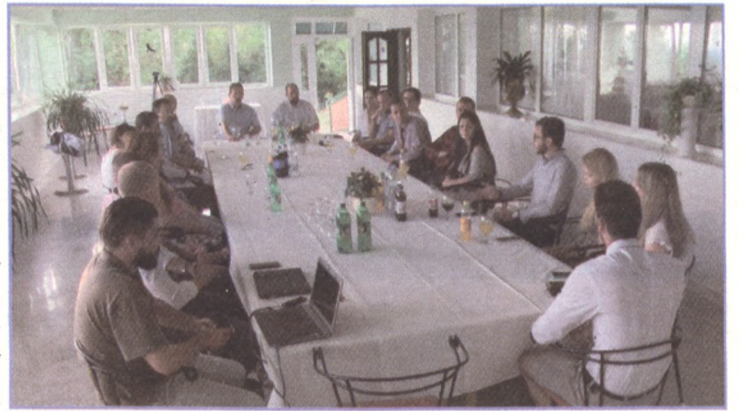
Fiatál Sátoraljaújhely Program elemei

„Sátoraljaújhely Polgármesterének Ösztöndíjasa”. Egyszeri támogatás havonta egy fiatalnak a város négy középiskolájából. 2014-től közel félszáz újhelyi tanuló kapta meg.