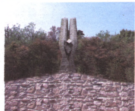
László Mária Látványterv: Patrónus Alapítvány

az előkészítő munkálatokat, az alapozást. A kivitelezés 25 millió forintos költségeinek a felét a sátoraljaújhelyi önkormányzat finanszírozza, a fennmaradó összeg összegyűjtésére a Patrónus Alapítvány közadakozást hirdet. A gyűjtés Szent György napján, azaz április 24-én indult és Szent Mihály napig szeptember 29-ig tart. A szervezet a felajánlásokat a Patrónus Alapítvány 11734138-20012773-00000000 számlaszámára vagy az Albatrosz Kft. Rákóczi út 10. szám alatti üzletében várja.