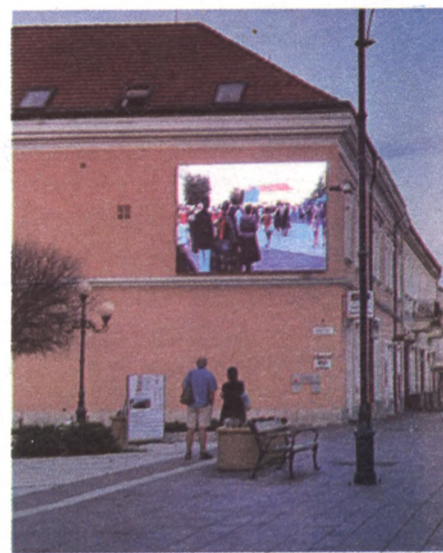
László Mária

a városközpontban. Egy másik pályázati program keretében a Kossuth tömb belsőben már készül a női, férfi, mozgáskorlátozott WC-vel illetve baba-mama szobával ellátott modern vizesblokk. A CLLD pályázat tartalmazza a Kossuth Lajos Művelődési Központ hátsó traktusának felújítását, a művészöltözők átalakítását is.