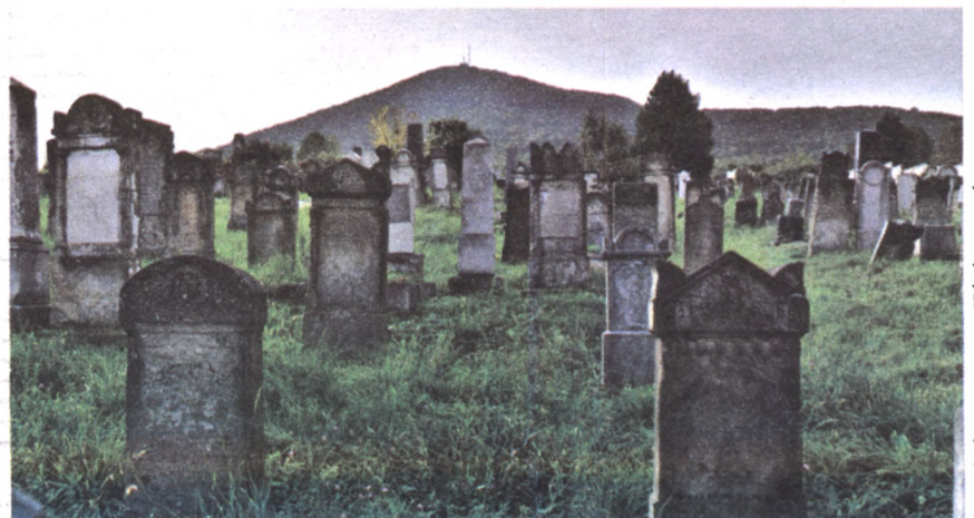
Fotó és szöveg: Tóth István

❖ SÁTORALJAÚJHELY VÁROS KÖZÉLETI LAPJA ❖ Felelős szerkesztő: Kassai-Balla Krisztina ❖ Tördelőszerkesztő: Pálincás Máté ❖ Kiadja: Seres Péter, Zemplén Televízió Közhasznú Nonprofit Kft. ❖ Felelős kiadó: Sátoraljaújhely Város Önkormányzata ❖ Szerkesztőség: 3980 Sátoraljaújhely, Színház köz 4. ❖ Telefon: 30/3286077 ❖ E-mail: ujhelyikorkep@satoraljaujhely.hu ❖ Készült: az Arany Napsugár Kft. Nyírségi Nyomda Üzemében, Nyíregyháza, Árok u. 15. Telefon: 42/437-007