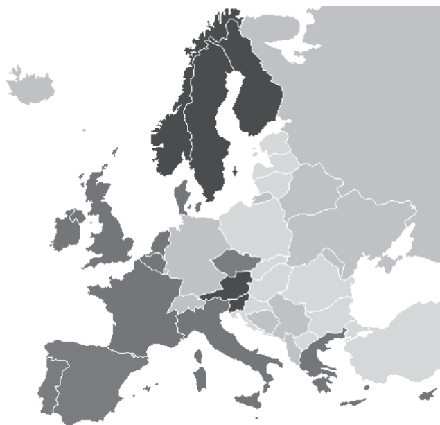
2. ábra: A vizsgálat során kialakult klaszterek