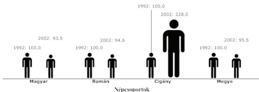
A népességváltozás Kovászna megyében népcsoportok szerint 2002 1992=100%