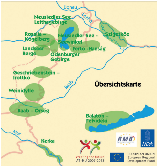
1. ábra: Nyugat-Dunántúl határterület turisztikai termékei

nem volt ipari fejlődés, mezőgazdasági nagyüzem, összekötő gyorsforgalmi utak, így a táji és nyelvi, kulturális identitás megmaradt. A volt határszakasz most érett abba az életkorba, hogy az eddigi hátrányt előnnyé kovácsolja a határon átnyúló fenntartható turizmus által. (1. ábra)