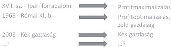
4. ábra: A gazdasági változások és paradigmák összefüggései (saját szerkesztés)

A gazdasági paradigmák a történelem folyamán változtak. A vizsgálatom szempontjából releváns felfogások változását a 4. ábra szemlélteti.