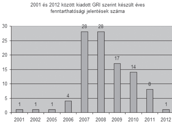
3. ábra: A GRI-nek megfelelő éves fenntarthatósági jelentések számának éves alakulása

(a KÖVET adatbázisa alapján saját szerkesztés)