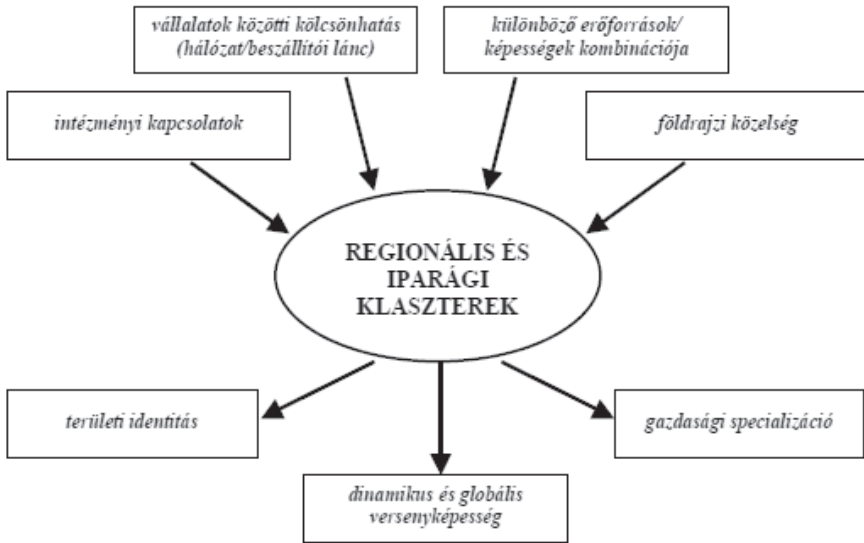
2. ábra: A különböző klaszter megközelítések közös dimenziói

A MAG Zrt 2012-es összefoglalója alapján „A hazai klaszterfejlesztési „politika” előtt álló talán legnagyobb kihívás annak elősegítése, hogy az eddig támogatásban részesült nagyszámú klaszterkezdeményezés közül minél több számára biztosítson továbbfejlődési lehetőséget, úgy hogy azok fenntartható módon nem pedig a fejlesztési források rendelkezésre állásától függően működjenek. Ennek első lépése lehet az egyes iparágakban viszonylag széttagoltan működő, alacsony taglétszámú klaszterkezdeményezés közötti kapcsolat erősítése, az eredményes működéshez szükséges kritikus tömeg elérése.” 78