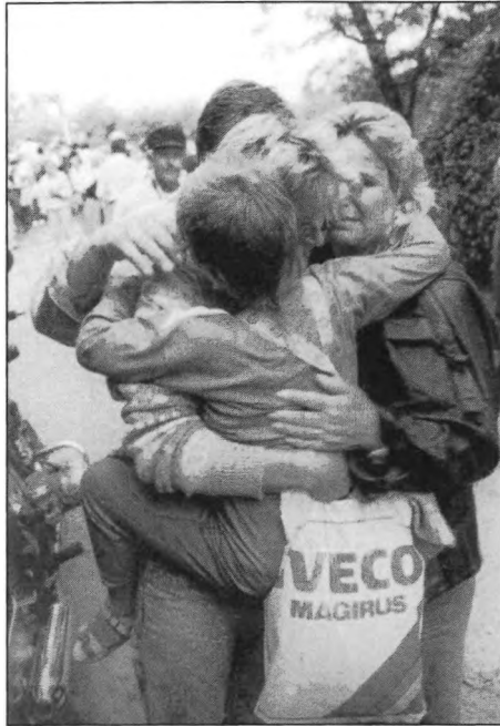
Biztonság / Sicherheit / Safety