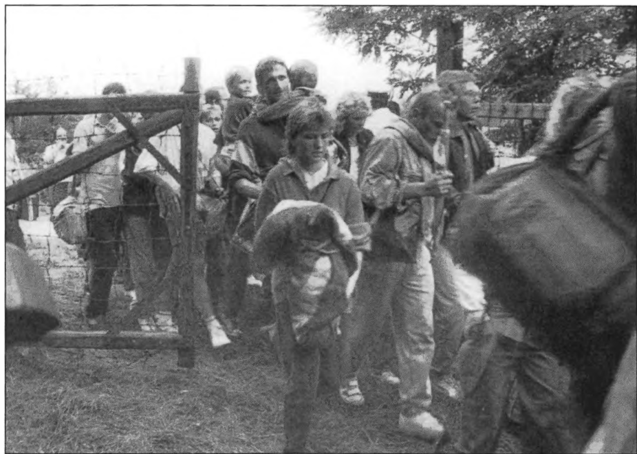
Átvonulás 1 / Transit 1 / Transit 1