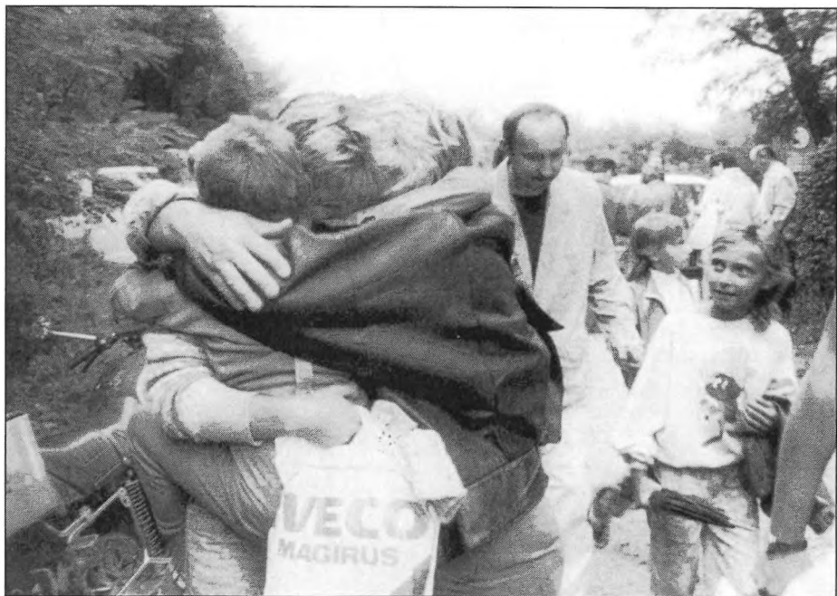
Hálaadás / Danksagung / Thanksgiving