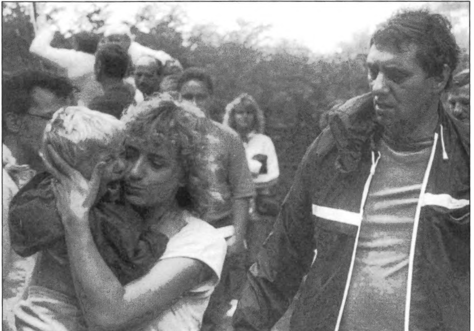
Együtt a család / Die Familie zusammen / Family together