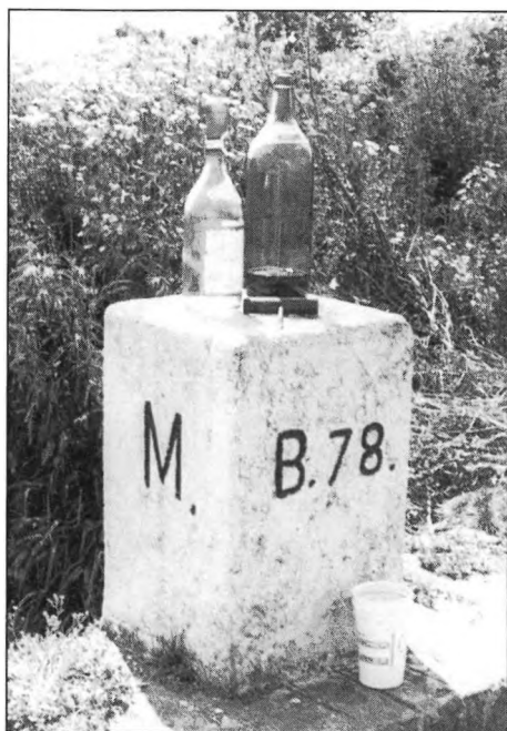
Határkö / Grenzstein / Milestone