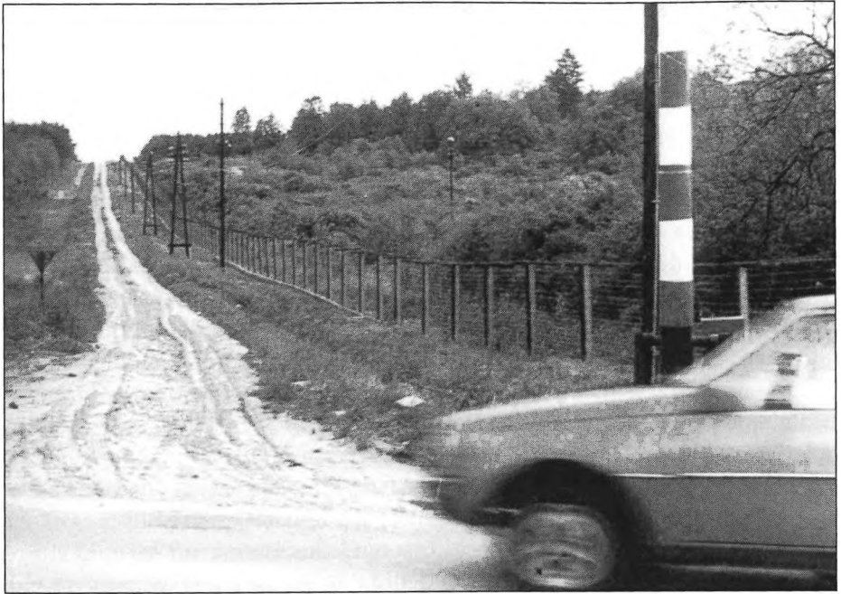
Vasfüggöny / Eiserner Vorhang / Iron curtain