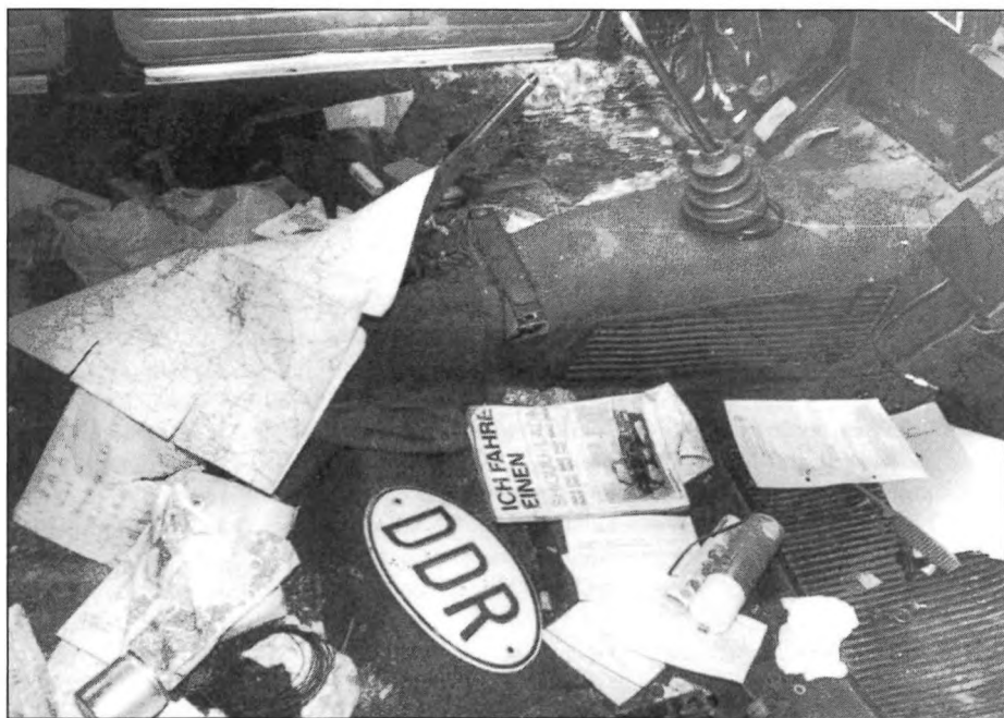
DDR maradványok / Reste der DDR / Residues of DDR