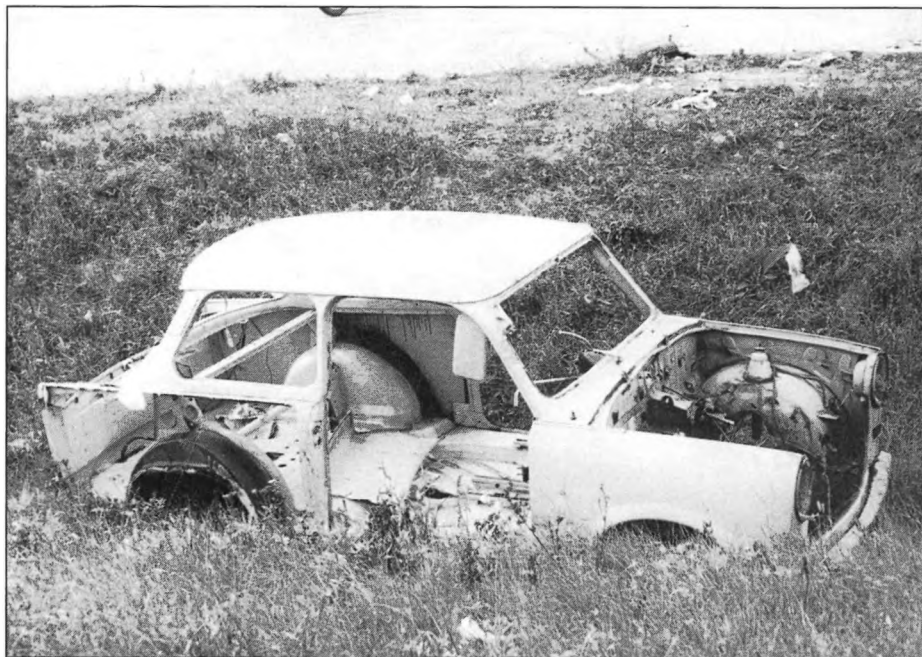
Trabi maradványok / Reste von Trabi / Trabi Residues