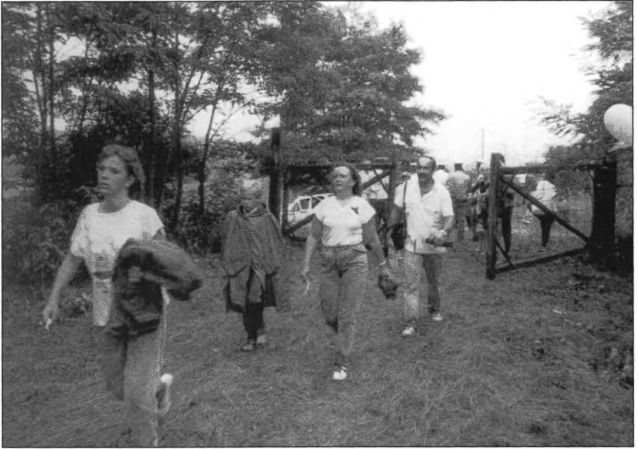
Átvonulás 2 / Transit 2 / Transit 2