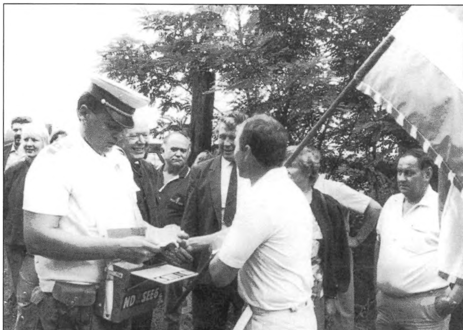
Határőr tiszt / Grenzschutzbeamte / Frontier guard