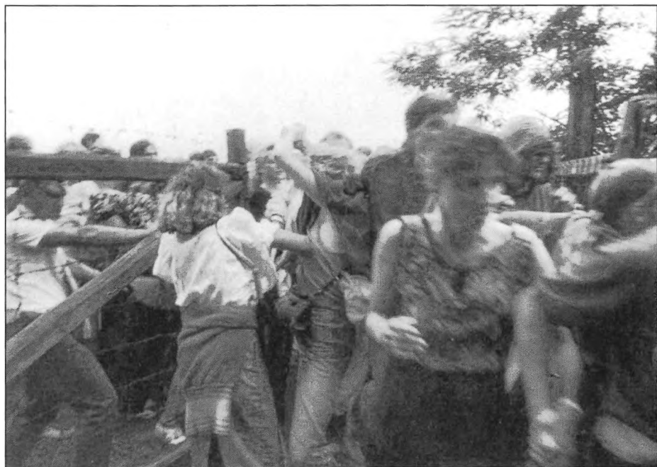
Áttörés 2 / Durchbruch 2 / Breakthrough 2