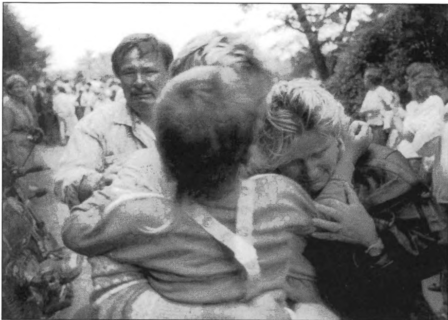
Megkönnyebbülés / Erleichterung / Relief