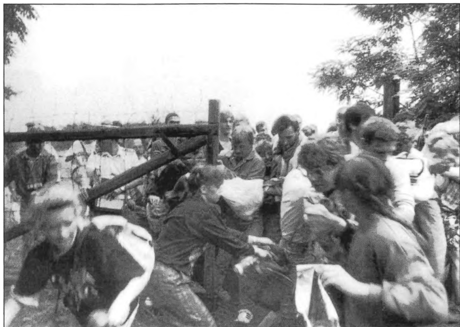
Áttörés 1 / Durchbruch 1 / Breakthrough 1