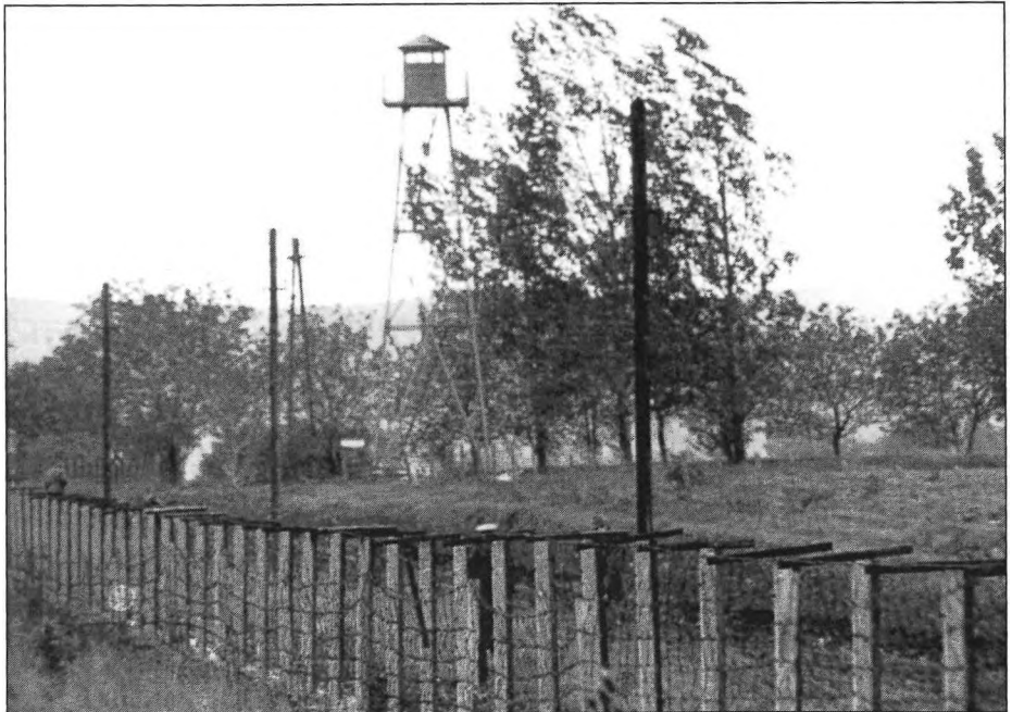
Őrtorony / Wachturm / Watchtower