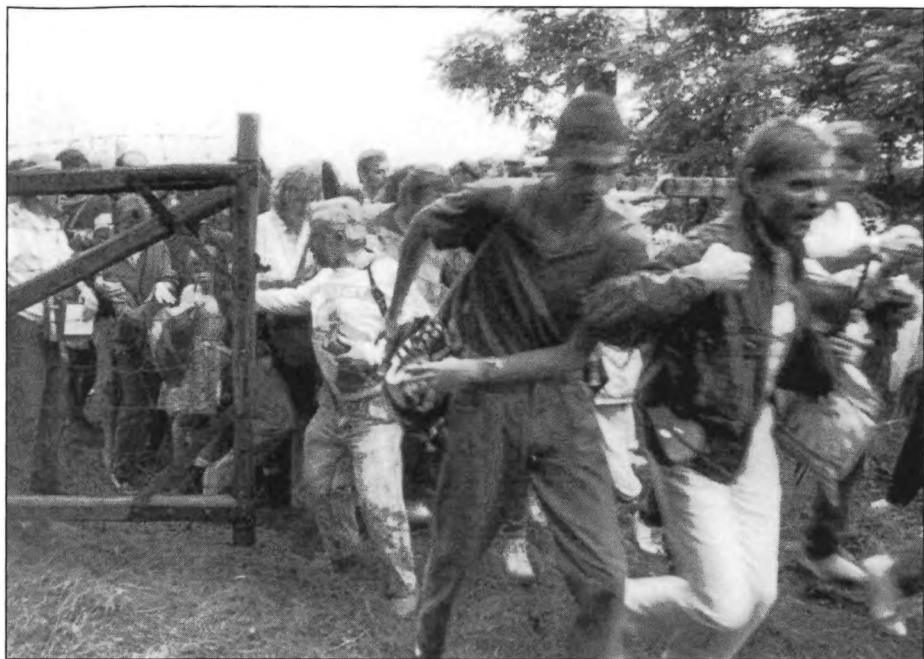
Áttörés 3 / Durchbruch 3 / Breakthrough 3