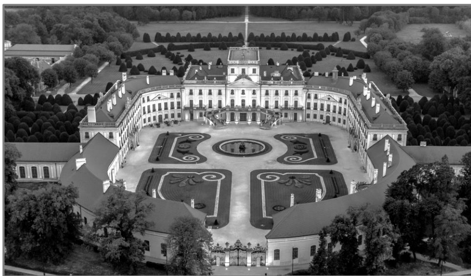
2. ábra: A helyreállított Eszterházy-kastély, Fertőd

egyik legismertebb helyszínévé is vált Joseph Haydn közel 30 évi eszterházi alkotása révén. Az 1800-as években jelentősége hanyatlott, komoly károkat szenvedett, elsősorban a korábban nagy adóssággal terhelt birtok elhanyagolása miatt, majd a huszadik század első felében a tulajdonos, herceg Esterházy Miklós jórészt felújította, de kulturális, politikai, szellemi életben játszott korábbi szerepét már csak a Párizs környéki békeszerződések révén megváltozott államhatárok következtében sem valósíthatta meg. A második világháború alatt hol orosz hadikórházként, hol lak-tanyaként, raktárként stb. funkcionált, amely állagának jelentős romlásával, berendezéseinek elvesztésével, megrongálásával járt.