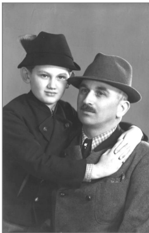
Az erdész édesapával

1929-ben Kapuváron született, Mihailovics Sándorként, régi nemesi családba. Felmenői között találhatóak német, magyar, lengyel és szlovák ősök is. Édesapja a családi név továbbvitele miatt vette fel a Lámfalussy nevet. Gyermekkorát Lentiben töltötte, majd Sopronba költöztek, ahol édesapja az Esterházy-birtokok erdészeti főigazgatója volt.