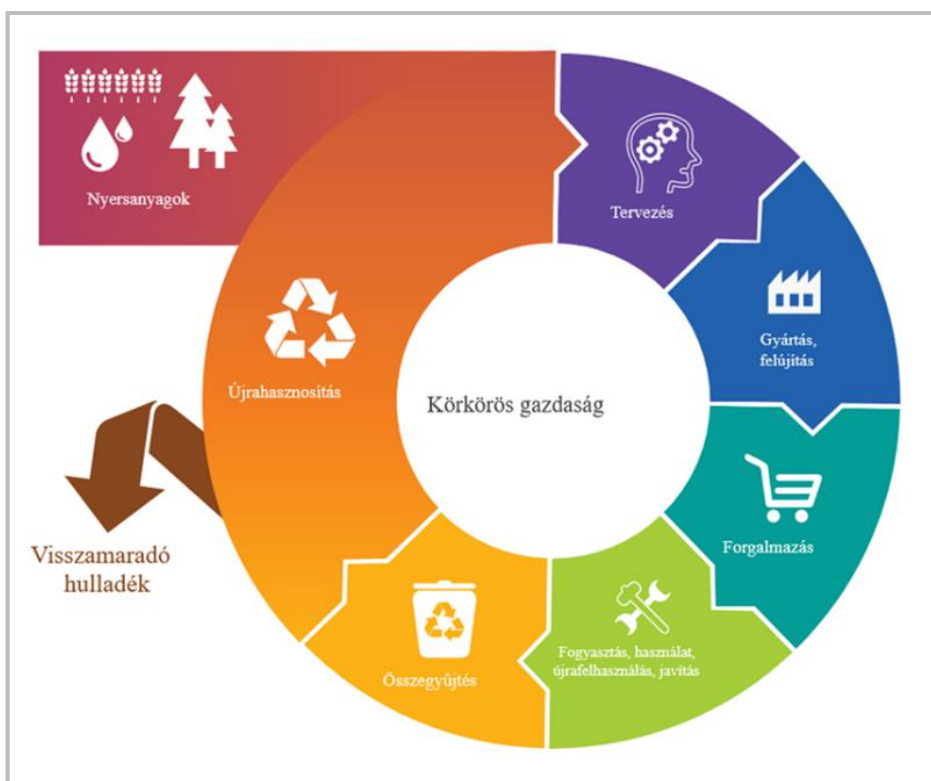
1. ábra: Körforgásos/körkörös gazdaság

A népesség és vele a nyersanyagok iránti igény növekedése miatt egyre szűkösebbek az erőforrások. Számos nyersanyagot nem helyben a felhasználás helyén termelnek ki, és a környezetre is komoly hatással van a nyersanyagok termelése, szállítása és felhasználása. A nyersanyagok hatékonyabb felhasználásával csökkenthető a szén-dioxid kibocsátás. A hulladékcsökkentés, a környezetbarát terméktervezés és a termékek újbóli felhasználása a vállalkozások számára rengeteg megtakarítást jelenthet, és csökkentheti az üvegházhatású gázok kibocsátását. A körforgásos gazdaság csökkentené a környezetre nehezedő nyomást, biztosítaná a nyersanyagforrásokat, valamint javítaná a vállalkozások és az Európai Unió versenyképességét is. Az 1. ábra szemlélteti a körforgásos gazdaság alapjait.