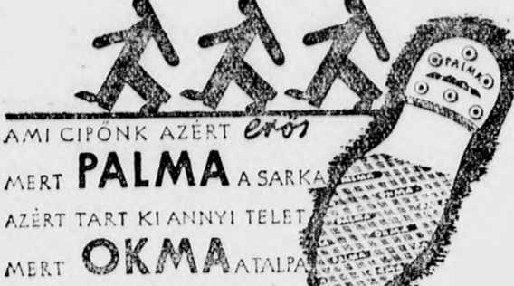
AMI CIPONK AZERT... PALMA A SARKA... AZERT TART KI ANNYI TELE... OKMA... ATALPA...

Ez a fogalom, „zsidó antiszemizmus” nem új és nem is szörványosan fordul elő a világban. Így például létezik Amerikában is. Most aktuális lett újra egy kongresszussal kapcsolatban,