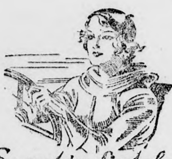
Sok nő akárcsak hangzik el, sőt még bizonyos mértékig, azt is megengedik — Pedig minden nő megszerezheti egyszerű és nem költéses módon, a fiatal, névnyos, arcsú, ha alábbi módon leveti az arcbőrét.

De ez nem egyedülálló eset. Ilyenek a „normális” eladások. Működtek a nemzeti szociálista párt, amely ma a német államgondolat és kulturális megtestesítője. Ily rabolják ki a zsidókat. Ezt a náci ideológiában úgy nevezik: „A zsidó tulajdon és befolyás csökkentése” a valóságban „Juda verrecke” gondolat végrehajtása. — Ez a csatalkáltság szüz-