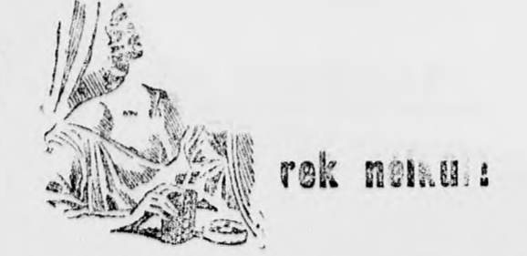
Solterer nő, hála a Leton szappannak, megszerezte és megörzi az annyira irigylt üdö, hármasos aessint alább íer egyet, nem köneges moacn.

— KKL, országos konferencia Prágában Nov. 17-én tartotta Prágában országos konferenciáját a csehszlovákiai KKL. A konferencián előadottakból kiderült, hogy a legutóbbi évben 2.350.000 csehszlovákia gyűlt össze, amely a legnagyobb volt az összes cdiigi évek eredményei között. A KKL működésére, azt hitték általában nem következtet be. Ellenkezőleg, csak növekedett a bevétel és főleg az ifjuság munká-