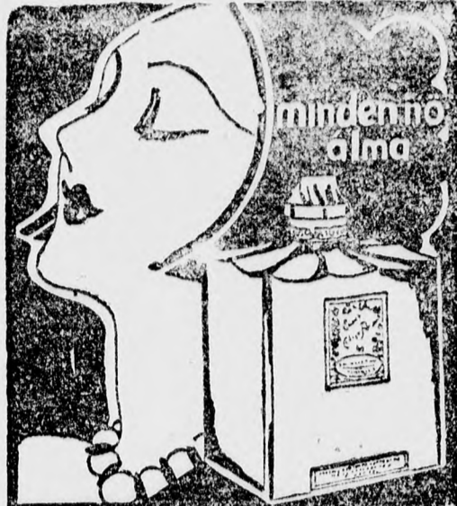
Molinar és Moser Kölniviz

Meg kell mondjuk, mert már igen régen nyomja lelkünket, hogy e hallgattuk, hogy sem kultuszegély, sem a szombai irásköte lezettség felfüggeszése az iskolákban, sem a gabella-ügyek, sem a hitközségi bétének, ugyahogy való hatalmi szóval való fenntartása sohasem sikerült volna -- ha ezek a fenntevetett hivataluk magasztalan álló reprezentánsok, nem mennének és nem rohanának az első hívó szóra. Mennek lekezes, önzetlenül, semmiféle elismerést sem várva de viszont azt nem várják -- és joggal nem várják -- hogy amikor közös zsidó összefogásról van szó, akkor jöjjenek, a patenterozott orthodox vezetők és azt mondják, ezek