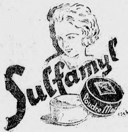
Sulfamyl puder csak