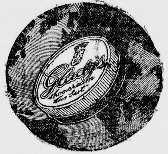
GLADYS fáplálja a lábballi bőrét, tartósságot és rugalmasságot ad neki. GLADYS szép és tartós lény ad.

fér bele egyetlen GLADYS CIPŐKRÉMES dobozba?