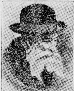
Reb Arje Lëb ben Avrohom Mordechai Alter gerer rebbe

...kintbe vesszük, hogy világsszere több száz-ezer híve van, akkor értékeihez csak kéllőleg, mit jelent ez a szö „gerer rebbe”.