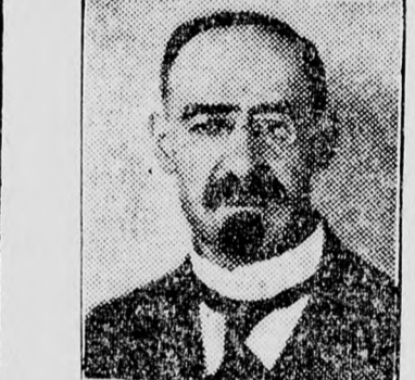
Dr. LEO BECK berlini főrabbi a német Bné Brit nagyelnöke