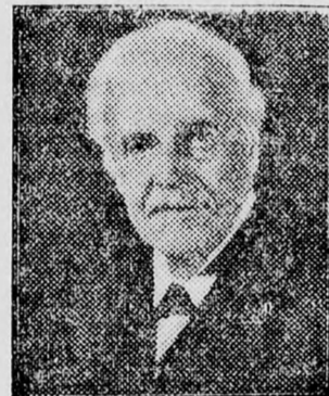
Lord A. J. BALFOUR

Ha nem lett volna Lionel Walter szejorja Rotschild háznak, ha nem lett volna a világ