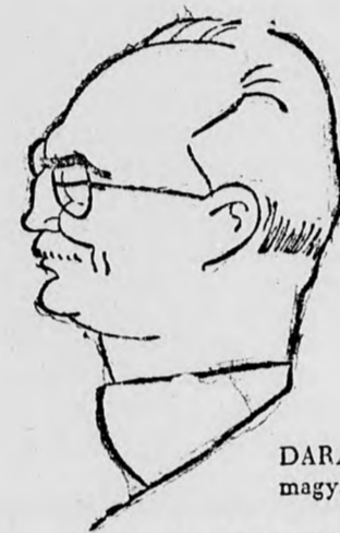
DARÁNYI KÁLMÁN magyar miniszterelnök