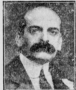
FELIX M. WARBURG

Nincsen az ötmilliósi amerikai zsidóságnak olyan felnötte, de a többmilliósi lengyel zsidóságnak sem, aki ne mondaná el a „ boruch da jon emet ”-et, amelyet a baláreset hallatára kell elmondani minden zsidónak. Aki pedig már olyan messzire esett a zsidóság lényegétől, hogy ezt nem tudja, az a saját anyanyelvén kell elmondja: legyen emléke áldott. Igen, legyen emléke áldott annak a Félix M. Warburgnak, aki hirtelen elhunyt New-Yorkban 67 éves korában és világraszóló típusa volt annak a világszerte áldástórszó zsidó filantrópoknak, akikből — sajnos — napról-napra kevesebb lesz. A lengyel gettóiban siratják, mert tengerenyi könnyet zártított