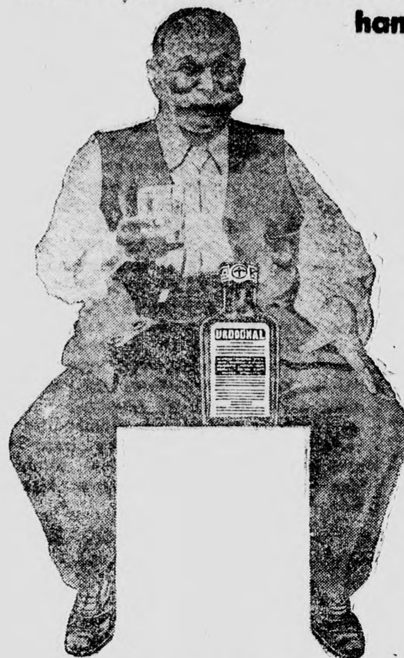
Kapható gyógyszerárakban és drogériákban

A mindennapos Urodonal kezelés megerősít, újíja le.