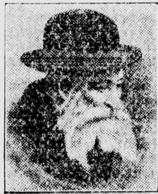
A gerer rebbe

NEM LEHET JUDGEGEKEL BIRNI... Bucurest, január elején. Háláspáti arc mered élm egy bukaresi harmadrendű szálloda szegényes szobájában. Vajaki figyelemmel arra, hogy itt találók egy lengyelországi zsidó menekültet, aki részleteket tud elmondani azokról az eseményekről, amelyek az utóbbi hónapokban lejátszódtak a németek által megszállott lengyel területeken. Egy szemek és sápadt borotás arc, reszkető kezek, révedező tekintet és akadozó beszéd festi alá mindazt, amit rapszódikusán elmond az a szerencsétlen testvérünk.